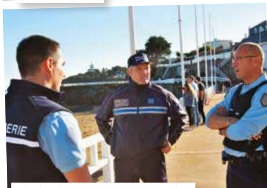
Police / Gendarmerie: un partenariat au quotidien.