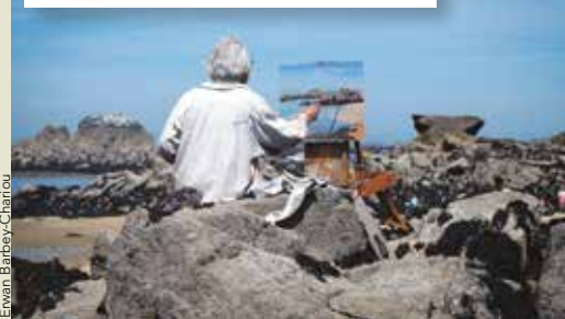
Saint-Quay-Portrieux immortalisé sous le pinceau des artistes