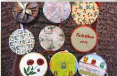
Les associations, ici le Patchwork, ont décoré des dizaines de CD.