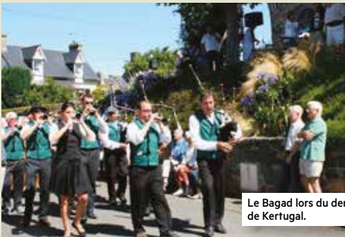
Le Bagad lors du dernier pardon de Notre Dame de Kertugal.

*Avant la création du Bagad et des Danserien tels que nous les connaissons aujourd'hui, la culture bretonne était portée par la "Kevrenn" de Saint-Quay-Portrieux. Né en 1959, il regroupait musiciens et danseurs au sein du même collectif. Il disparut au début des années 80.