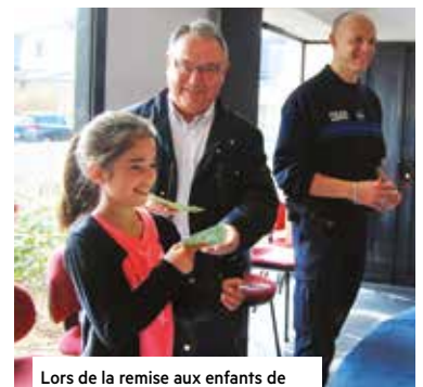
Lors de la remise aux enfants de leur "permis d'éducation routière"