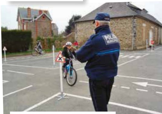
Sur la piste d'éducation routière de l'Espérance.