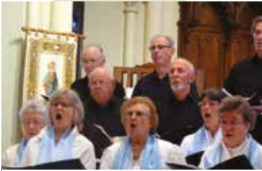
Les Kanerien ar Goëlo en concert le 1 er décembre.

Le 3 octobre dernier, l'AFM Téléthon des Côtes d'Armor a choisi Saint-Quay-Portrieux pour lancer