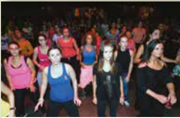
La Zumba Party du 25 novembre promet une belle ambiance.