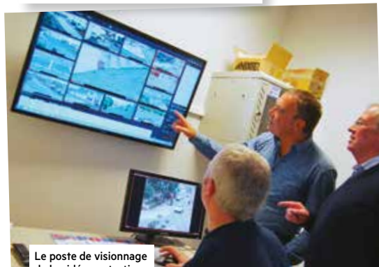
Le poste de visionnage de la vidéo-protection.